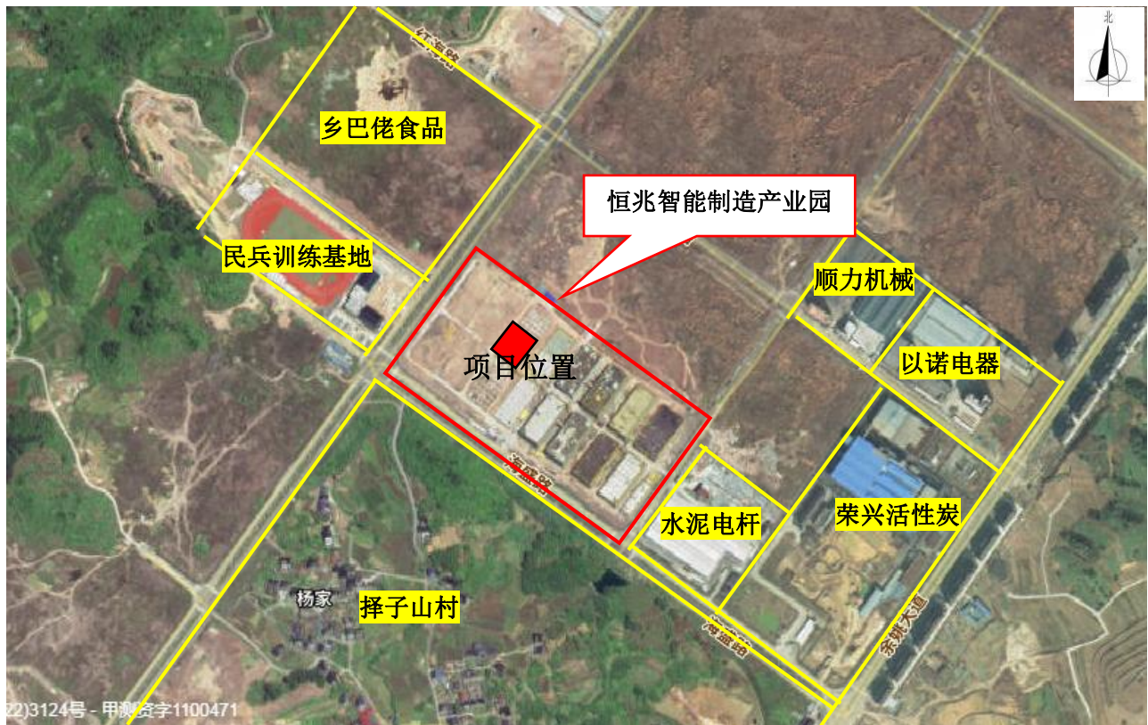
图 2-1 厂区周边示意图