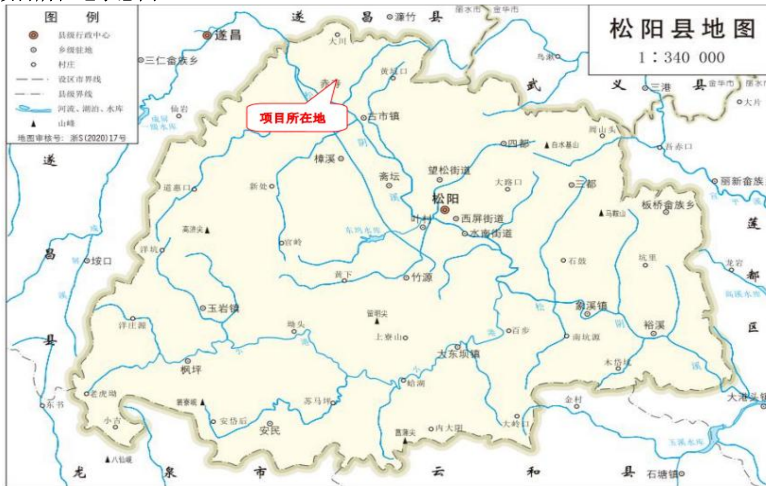
附件 1: 项目所在地示意图